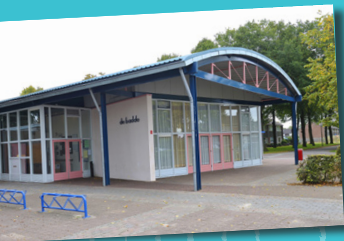
multifunctioneel centrum De Badde

U kent natuurlijk het multifunctioneel centrum De Badde bij u in het dorp. Het is de plek waar u terecht kunt voor de jeugdsoos, 55+ gym, koersbal, het consultatiebureau of de trombosedienst. Vanaf 1 november 2011 vindt u hier ook het Infohuus Nieuw Weerdinge. Iedereen, jong en oud, kan er terecht voor informatie en praktische hulp. In deze folder leest u er meer over.